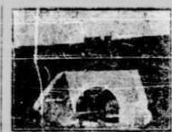
Pod de c. f. Babadac